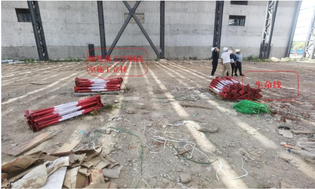
图五 6号厂房南半幅地面