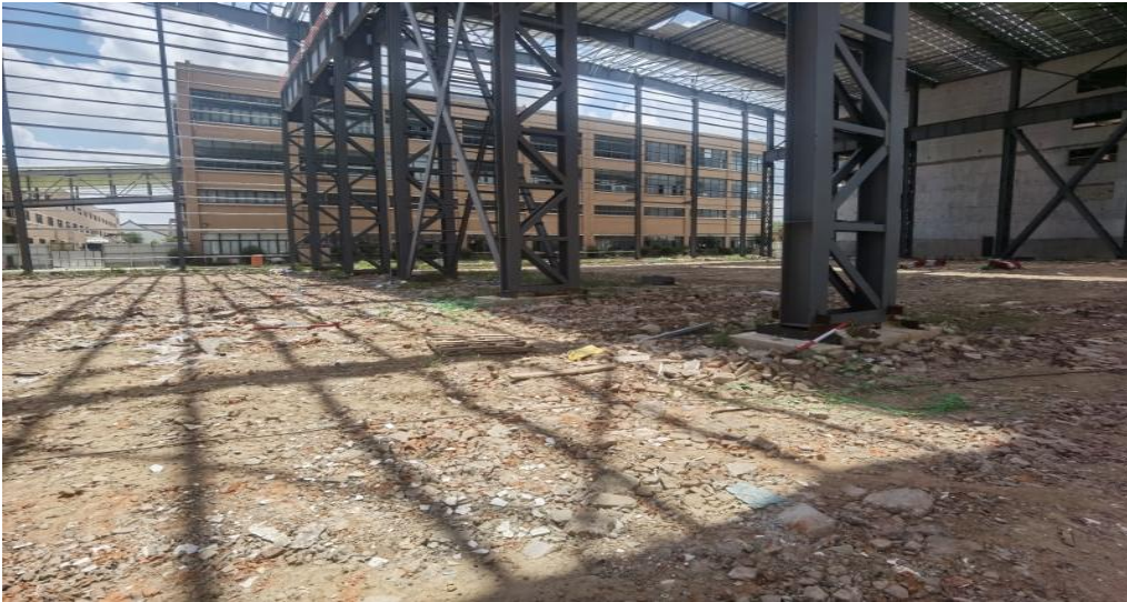
图四 6号厂房北半幅地面

4.钢结构施工区域无生命线及水平安全网。钢结构厂房北半幅地面散落 11 处生命线立杆，少许立杆上有绿色生命线；南半幅地面有生命线立杆堆垛和绿色生命线，立杆底部有明显磨损。